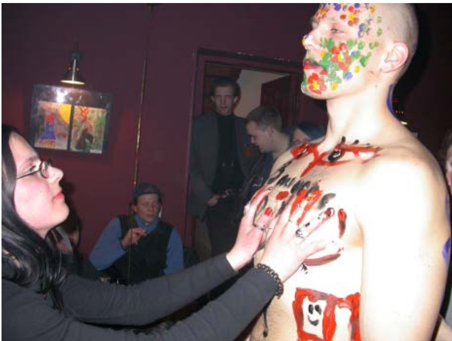
Mergiotės puikiai naudojasi proga...