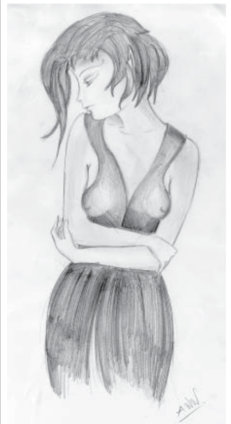
Ezellor piešinys. Daugiau apie autorių žr. 4 p.