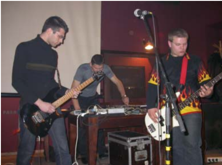
Konvente grojo grupė AD FICTION.