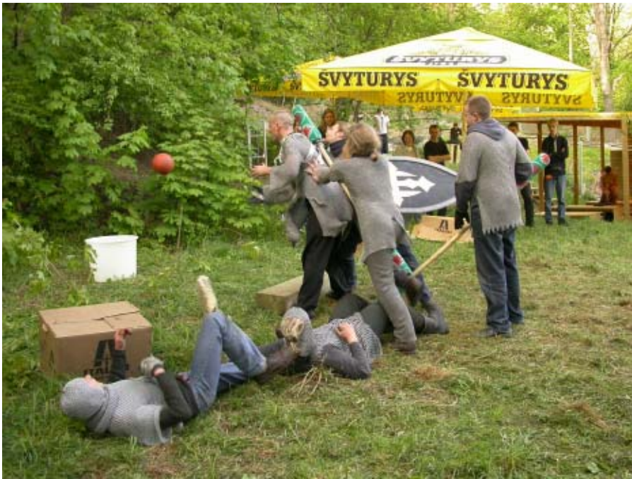
basketBLOODball bum bumm bumm.