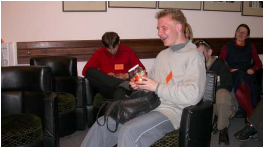
Laimės pilnos kelnės aukcione nusipirkus pomidorą žudiką.