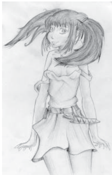
Ezellor (elfiškas vardas) piešinys

Ant pirštų galų pasistiebus, Vaikai tirpstantį miegą; Giliai atsidusus, žiovilų išpūtus, Toks šviežias ir apsvaigęs Gyvenimui šypsaisi.