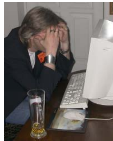
Kauno inteligentas Bangis turbūt jau įtaria būsimą degtinės butelio sudaužymą (redakcija liūdi kartu).