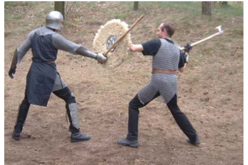
Nuotrauka iš eilinės treniruotės prieš lauko žaidynes.

ne tik masinis teatralizuotas mūšis, bet ir parodomosios karių dvikovos.