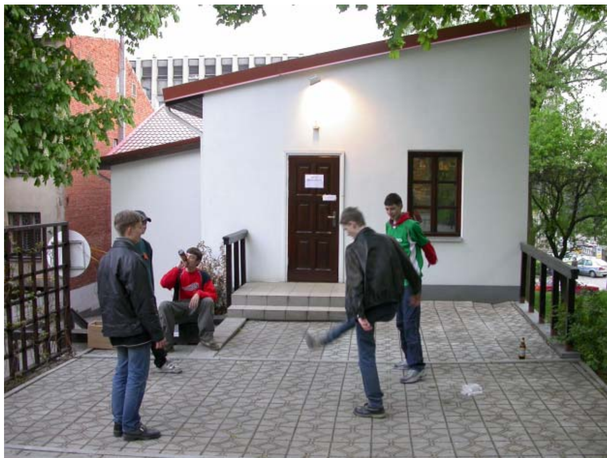
Sportas - sveikata. Belaukiant ko nors įdomaus galima ir savų atrakcijų prisigalvoti.