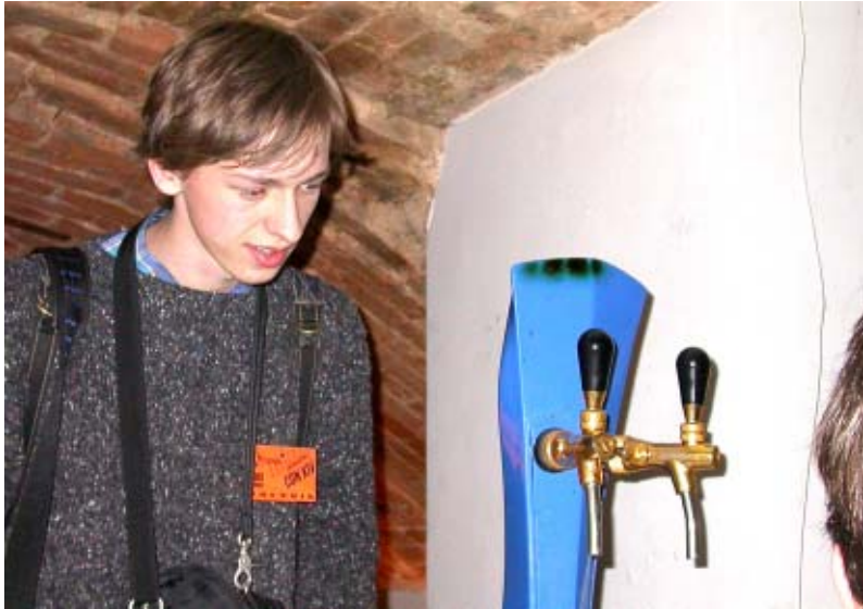
Visuomet malonu pamatyti šviežutėlius naujokėlius konvento džiunglėse.

Šiaip rašau, fotografuoju. Savo kūrybos niekur nepublikavau (Vienžo, žalias fantastikoj).