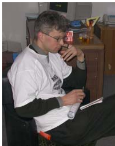
Vilniaus barbaras Maumuliz.

Ji ishtiesia delna. O ten - mamamia, melynna piliuleA