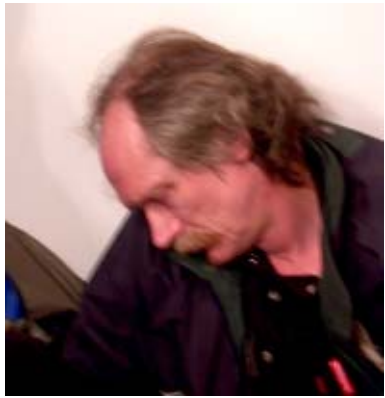
Gera ta lietuviška starka...

Programa baigėsi. Liko neišaiškinti nugalėtojai. O jų ir nebu-