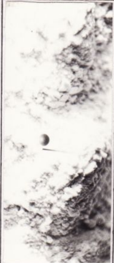
← Renaldo Žilinsko fotomontažai 1992