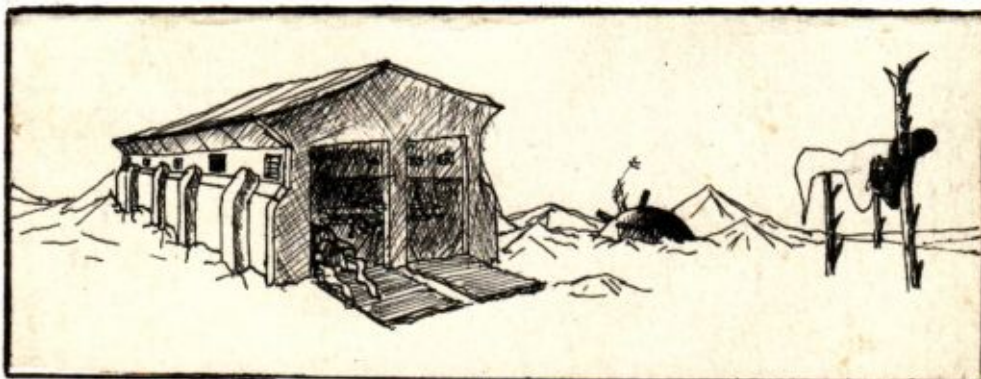
Dariaus Gečo iliustracija ▲

"Yra" parengta 1999. 08 .17 d. 12 egz. tiražu