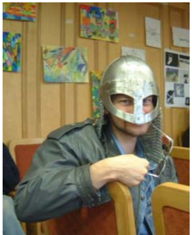
Ir aš ten buvau.